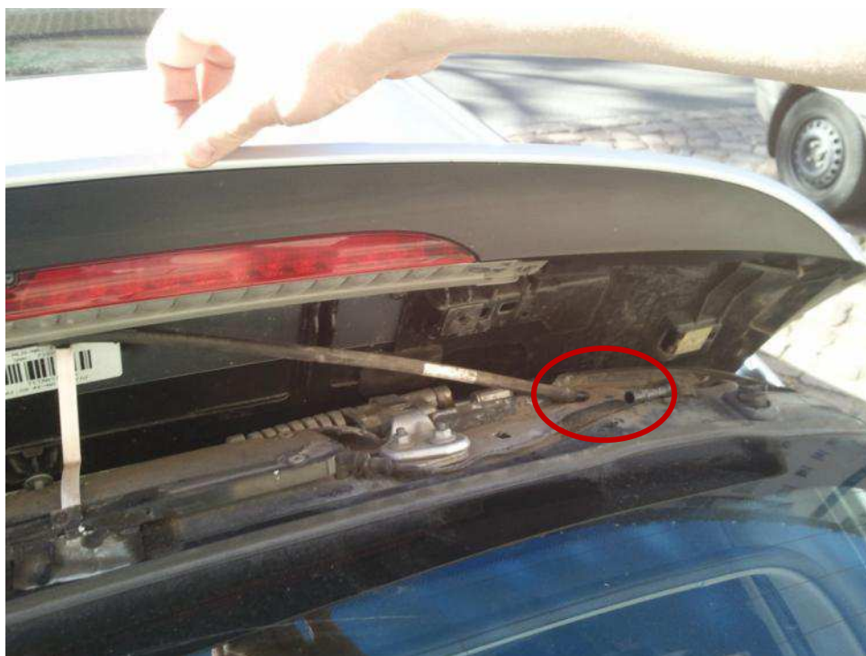
Heckspoiler gelöst - Schlauch sichtbar und schon getrennt