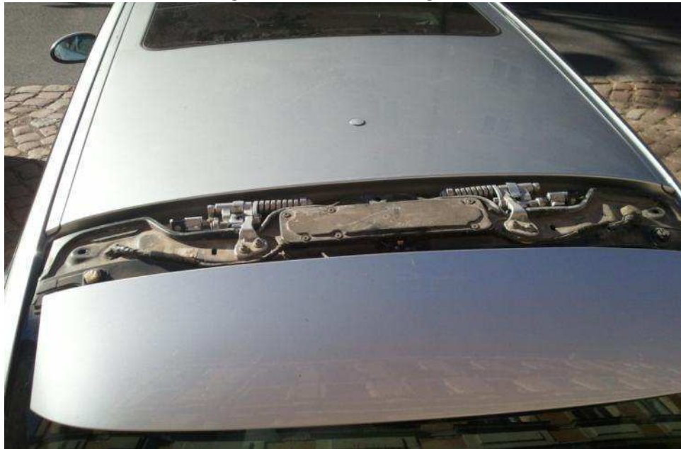
Heckspoiler gelöst und nach unten geschoben